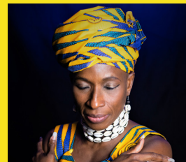
Si vous écoutez : Fatoumata Diawara, Oumou Sangaré, Rokia Traoré