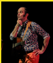
Si vous écoutez Bénabar, Oldelaf