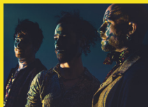
Si vous écoutez: Lo'Jo, Les Hurlements d'Leo, Massilia Sound System