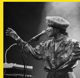
Si vous écoutez Pomme, Clara Luciani, Camille

QUINTET voix, percussions, guitare, basse, claviers